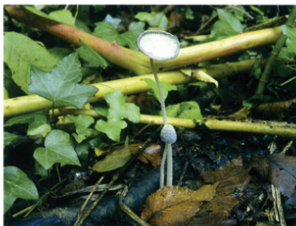
Fig. 2.25 – Esempi di Coprinus : ornamentazioni del cappello nello sporoforo immaturo (in basso); margine plissettato e revolut, non ancora deliquescente, nello sporoforo maturo.