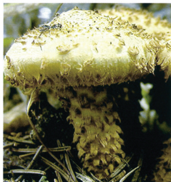
Fig. 2.24 – Placche residue del velo generale sul cappello di Amanita vaginata (sinistra), ornamentazioni in Pholiota squarrosa (destra).